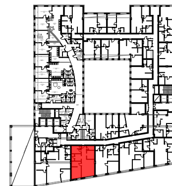
C ÉPÜLET 1. EMELET SZINTRAJZ