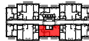
J2 ÉPÜLET 1. EMELET SZINTRAJZ