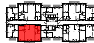
J2 ÉPÜLET 2. EMELET SZINTRAJZ