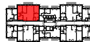
J2 ÉPÜLET 2. EMELET SZINTRAJZ