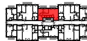
J2 ÉPÜLET 2. EMELET SZINTRAJZ