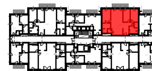
J2 ÉPÜLET 2. EMELET SZINTRAJZ