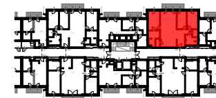
J3 ÉPÜLET 1. EMELET SZINTRAJZ