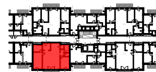
J3 ÉPÜLET 1. EMELET SZINTRAJZ