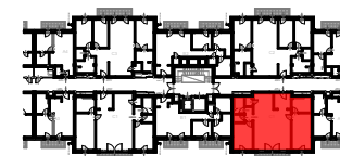
J3 ÉPÜLET 2. EMELET SZINTRAJZ