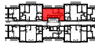
J3 ÉPÜLET 2. EMELET SZINTRAJZ