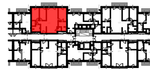
J3 ÉPÜLET 2. EMELET SZINTRAJZ